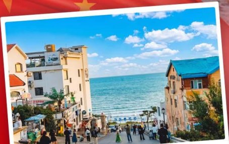
ถนนคอปเปลี่งหมายเลขแปด