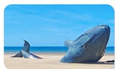
ประติมากรรมวาฬผู้โดคเตี่ยว