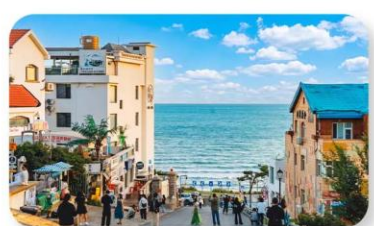
ถนนคอบเพลิงหมายเลขแปด