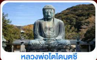
หลวงพ่อดาโตะบุตซึ