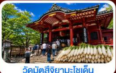
วัดมัตสึงายาเมะโชเด็น