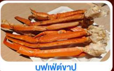
บุฟเฟ่ต์งาปู