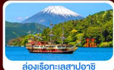
ล่องเรือทะเลสาบอาชิ

28 ส.ค.-02 ก.ย.69 18-23, 23-28 ก.ย.69 04-09, 11-16 ก.ย.69 24-29, 25-30 ก.ย.69 16-21, 17-22 ก.ย.69 30 ก.ย.-05 ต.ค.69