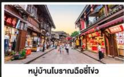
หมู่บ้านโบราณฉือซีไว่