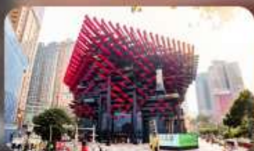
ดิถุติเย็บ