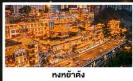
หงหย่าต้ง