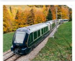
รถไฟโกลด์นพาส