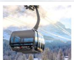
นั่งรถเข้ายอดเขาจุงเฟรา