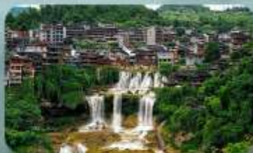
หมู่บ้านฟุ่หลงเจิ้น