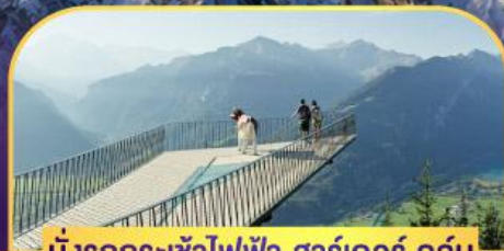
นั่งรถกระเช้าไฟฟ้า ชาร์เดอร์ คูล์ม