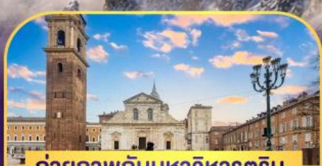
ถ่ายภาพกับมหาวิหารดูริน