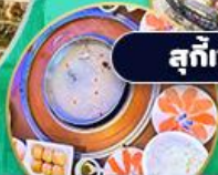
ชาบู แซลม่อน