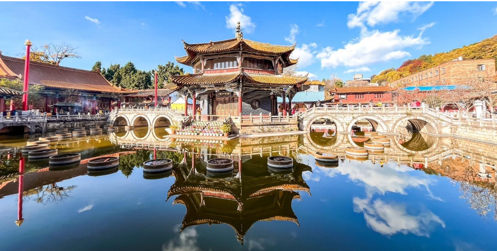
นิกายลามะของทิเบต

จากนั้น นำท่านเดินทางไปยัง วัดหวนทอง อารามทางพระพุทธศาสนาที่ใหญ่ที่สุดในคุนหมิงอายุเก่าแก่กว่า 1,200ปี สร้างขึ้นมาตั้งแต่สมัยราชวงศ์ถัง เป็นวัดที่ใหญ่และเก่าแก่ของมณฑลยูนนาน ภายในวัดตกแต่งร่มรื่นสวยงามกลางลานมีสระน้ำขนาดใหญ่ มีสะพานข้ามไปสู่ศาลาแปดเหลี่ยมกลางสระด้านหลัง ภายในวัดเป็นศูนย์กลางของพระพุทธศาสนาถึง 3 นิกาย ได้แก่ นิกายมหาญาณ นิกายหินญาณ และ