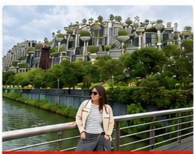
Tian an 1000trees