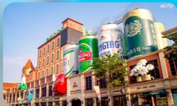
ถนนเบียร์ชิงเต่า