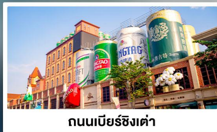
ถนนเบียร์ชิงเต่า