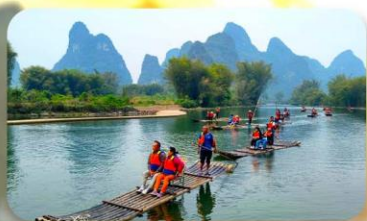
ล่องแพไม้ไผ่หยู่หลง