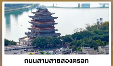
ถนนสามสายสองตอรอก