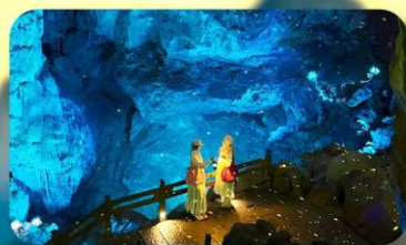
ถ้ำหลุย้อ