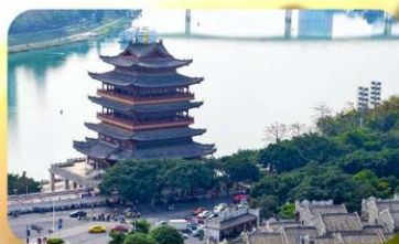
ถนนสามสายสองครอก