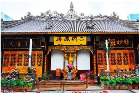
ถนนไท่กุ่หลี่ และวัดต้าเจี๋ย