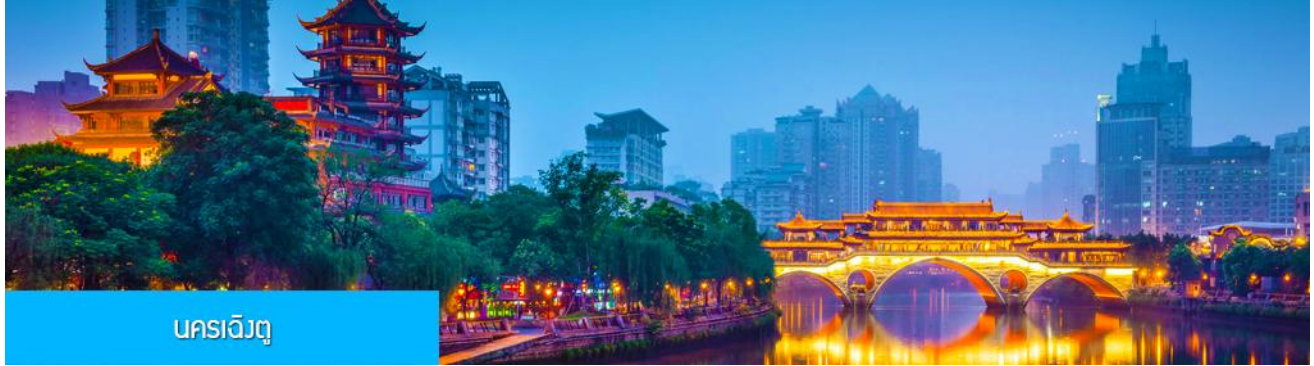
นครฉางตู