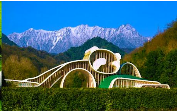
ศูนย์อนุรักษ์หมีแพนดามิวตงเจียวหยี่ย่น