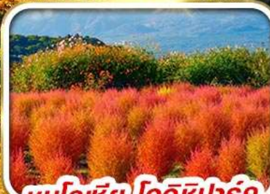
ชมโคเซียว โออิชิปาร์ค