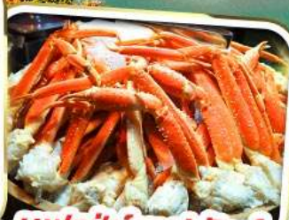
บุฟเฟ่ต์ขาปูยักษ์

ราคาเริ่มต้น 37,999 *รวมภาษีมูลค่าเพิ่มแล้ว*