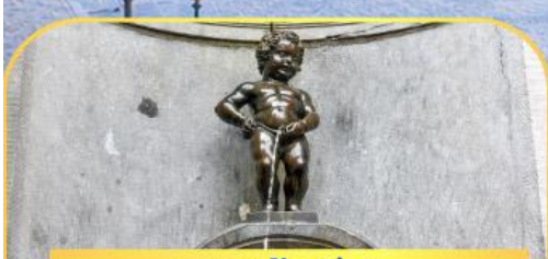
เมเนกันพีส