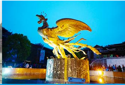
จัตุรัสหงส์