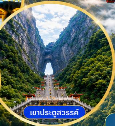
เขาประตูสวรรค์