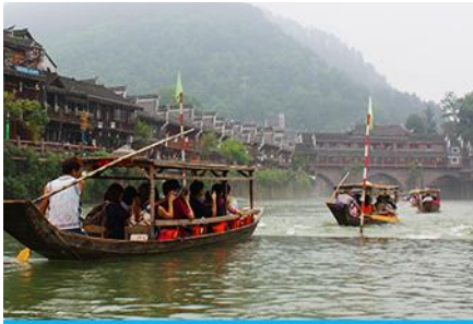
ล่องเรือแม่น้ำถั่วเจียง

หมายเหตุ การเดินทางเข้าเมืองโบราณฟงหวง ต้องนั่งรถเมล์ของเมืองโบราณ ท่านจำเป็นต้องหิ้วกระเป๋าเดินทางของท่านขึ้น-ลงรถเมล์ด้วยตัวท่านเอง เพราะรถบัสทัวร์เราไม่สามารถเข้าไปในเมืองโบราณได้ จอดส่ง ณ จุดขนส่งของเมืองโบราณเท่านั้น เมื่อเดินทางถึงเมืองโบราณฟงหวงแล้ว นำท่านเช็คอิน ณ โรงแรมที่พัก(อยู่ในเมืองโบราณใกล้แหล่งท่องเที่ยว)