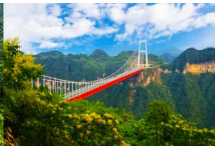
สะพาน ไร่จ้ายต้าเจียว