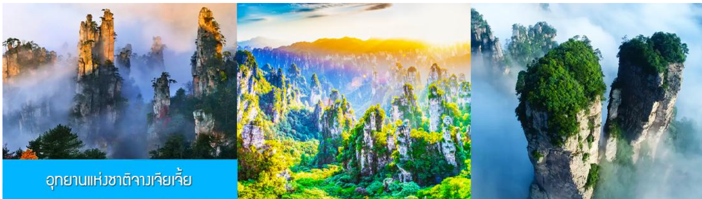
อุทยานแห่งชาติจางเจียเจีย

วันที่ห้า เมืองโบราณผู่หรงเจิ้น-เมืองจางเจียเจีย-ภูเขาอวตาร-ไกด์นำเสนอ OPTIONAL TOUR -เดินทางกลับเมืองหยี่ชาง