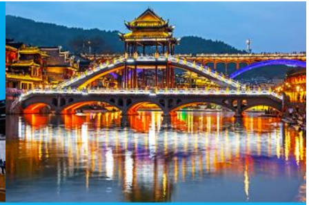
สะพานหงเจียว

นำท่าน นั่งเรือพายล่องแม่น้ำถั่วเจียง 游沱江 (ล่องเรือราว 10 นาที) ชมบ้านเรือนโบราณสองฝั่งแม่น้ำถั่วเจียง อันเป็นเอกลักษณ์ของเมืองโบราณแห่งนี้ สัมผัสวิถีชีวิตของชนเผ่าพื้นเมืองที่อาศัยอยู่บริเวณชุมชนนี้มาช้านาน เช่นชาวบ้านที่อาบน้ำ ชักผ้า หรือล้างผักอยู่ริมฝั่งแม่น้ำ บางครั้งท่านอาจได้เห็นชาวบ้านร้องเพลงพื้นเมืองขณะพายเรือในแม่น้ำ ช่างเป็นบรรยากาศแห่งมนต์เสน่ห์ที่ดึงดูดผู้มาเยือนสำหรับชุมชนชลบทแห่งนี้อย่างยิ่ง... นำท่านเดินเที่ยวชม เมืองโบราณฟงหวง 凤凰古城 เมืองโบราณเก่าแก่อายุหลายร้อยปี ชมเมืองที่สร้างขึ้นสมัยราชวงศ์ถัง เดิมมีชื่อว่า หงส์เจียวกู่เจิง มีกำแพงเมืองโบราณ และบ้านเรือนโบราณที่มีเอกลักษณ์เฉพาะของเมืองสร้างความโดดเด่นให้ที่นี่ บ้านเรือนโบราณในอดีตกาลบางส่วนถูกดัดแปลงเป็นร้านค้าและร้านจำหน่ายสินค้าที่ระลึกในปัจจุบัน ชม จัตุรัสหงส์ ที่มีรูปนกหงส์จำลองที่ทำจากทองเหลือง อันเป็นสัญลักษณ์ที่โดดเด่นของเมืองโบราณแห่งนี้...ชม สะพานหงเจียว 虹桥 สะพานไม้โบราณที่มีหลังคาคลุมเหมือนสะพานข้ามคลองในเวนิส สะพานแห่งนี้เคยเป็นด่านเก็บภาษีเกลือในสมัยราชวงศ์ซิง ซึ่งยังคงรักษารูปทรงในอดีตไม่เปลี่ยนแปลง เมื่อยามพลบค่ำ ท่านจะได้สัมผัสเมืองโบราณที่ประดับประดาด้วยแสงไฟและสีสันทันทีอย่างเต็มสุข