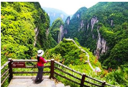
แท่น ปูจาตาสวรรค์

พักที่ ZUIXIANGXI HOTEL ระดับ 4 ดาวท้องถิ่นหรือเทียบเท่าในเมืองโบราณฟงหวง