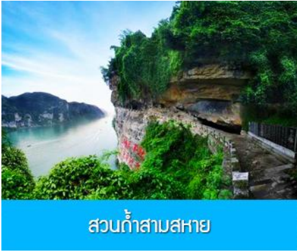
สวนกำสามสหาย