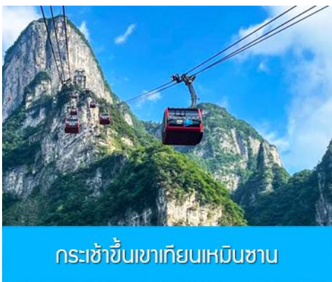
กระเช้าขึ้นเขาเทียนเหมินซาน

พักที่ HANTING HOTEL ระดับ 4 ดาวท้องถิ่นหรือเทียบเท่าในเมืองจางเจียเจี๋ย