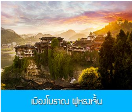
เมืองโบราณ ฟูหรงเจิน