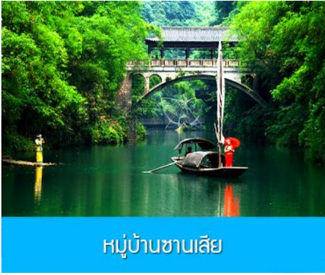
หมู่บ้านชาเลีย