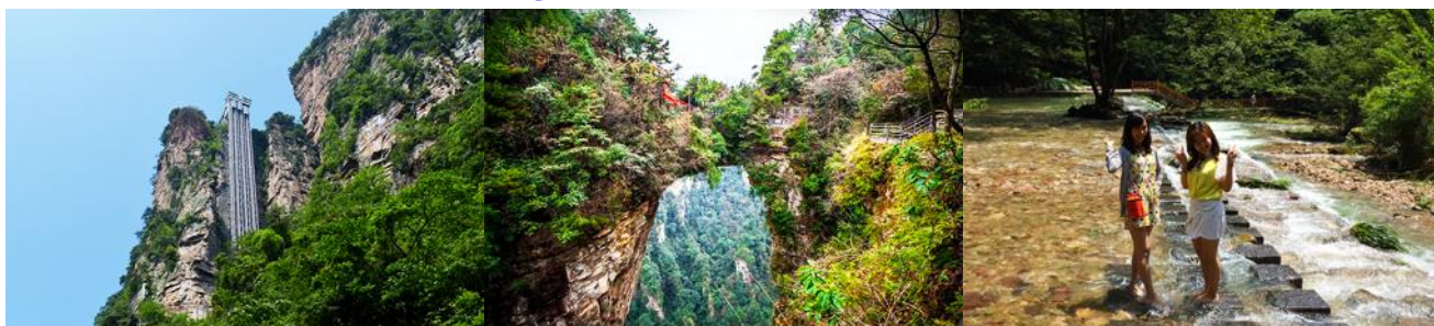
ลิฟท์แก้วไปหลง

หลังอาหารเช้าท่านเดินทางสู่ อุทยานแห่งชาติจางเจียเจีย 张家界森林公园 นำท่านโดยสารรถบัสของเขตอุทยานไปยัง สถานีลิฟท์แก้วไปหลง 百龙天梯 ให้ท่านโดยสารลิฟท์แก้วขึ้นสู่จุดชมวิวในเขตอุทยาน หยวนเจียเจีย 袁家界 จุดชมวิวยอดนิคม บนเขาอวตาร ลิฟท์แก้วไปหลง เป็นลิฟท์แก้วชมวิวกว้างแบบสองชั้นที่สร้างขึ้นเลียนหน้าผาแนวตั้งที่มีความสูงราว 325 เมตร เป็น ลิฟท์แก้วชมวิวกว้างความเร็วสูง ขนาดใหญ่ที่ทำลายสถิติกินเนสบุ๊ค.....ท่านจะตื่นตาตื่นใจกับทัศนียภาพบนเขาอวตาร บนความสูงถึง 1,250 เมตรเหนือระดับน้ำทะเล อาทิ ยอดเขาสีลูยา 哈利路亚山 ภูเขาลอยฟ้าโด่งดังที่เป็นฉากถ่ายทำภาพยนตร์เรื่องอวตาร