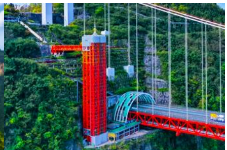
ลิฟท์แก้วอุทยานไร่จ้าย