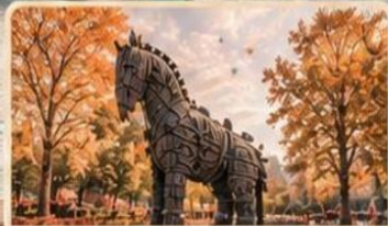
ม้าไม้จำลองทROY