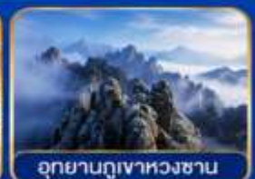
อุทยานภูเขาหวงซาน