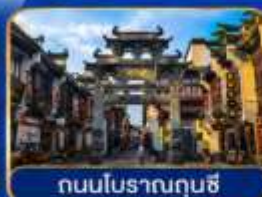
ถนนโบราณกุนซี