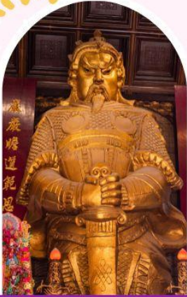
วัดแชกง ขอพรโชคลาภ การเงิน และธุรกิจ

"ไหว้พระ เสริมดวง เพิ่มสิริมงคลแก่ชีวิต"