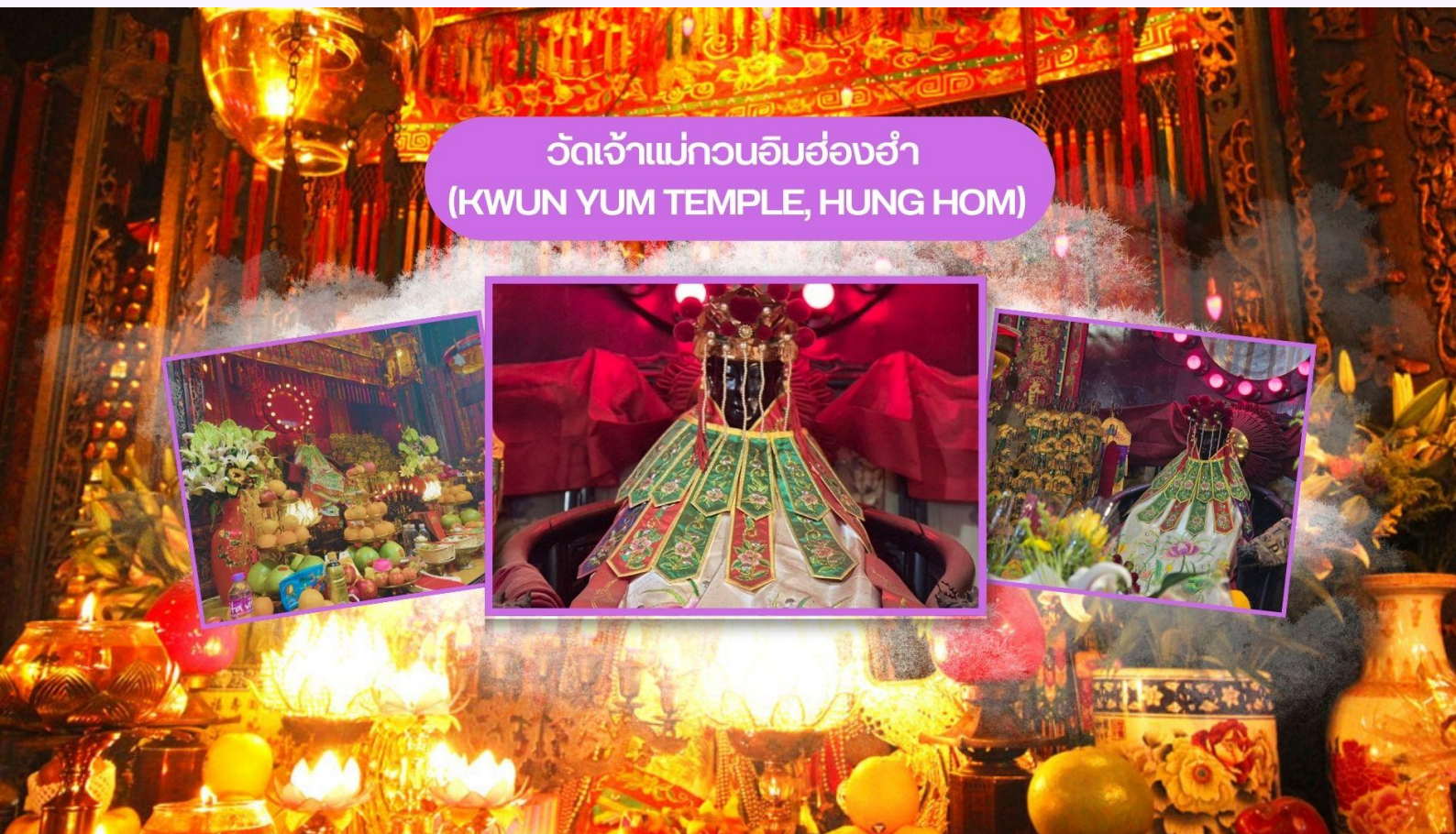
วัดเจ้าแม่กวนอิมฮ่องฮำ (KWUN YUM TEMPLE, HUNG HOM)

เช้า รับประทานอาหารเช้า ณ ภัตตาคาร บริการท่านด้วยเมนูติ่มซำฮ่องกง (มื้อที่ 3)