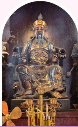
วัดปักไต้ เสริมโชคลาภ นำพาความรุ่งเรือง