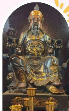
วัดกวนไท่ ความซื่อสัตย์ เงินทอง ธุรกิจมั่นคง