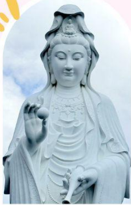
วัดเจ้าแม่กวนอิมซัน ความเมตตา ความสงบ สิริมงคล