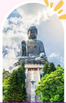
นั่งกระเช้านองปิง นมัสการพระใหญ่ไป่หวลีน