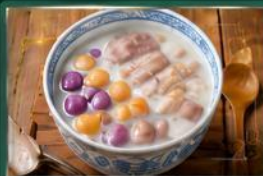
บัวลอยเผือกต้นตำรับ รสชาติหวานนุ่ม อร่อยต้นตำรับ ไม่ควรพลาด

อิสระเดินเล่น ณ หมู่บ้านโบราณจิวเฟิน (Jiufen Old Street) พร้อมลิ้มลองอาหารพื้นเมืองชื่อดัง