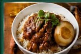
ข้าวหน้าหมูพะโล้ หมูนุ่มละมุน เคี้ยวจนหอมหวาน กลมกล่อม