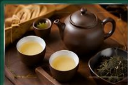
ชาอู๋หลงหอมกรุ๋น ชาหอมเข้ม รสกลมกล่อม จากแหล่งปลูกคุณภาพ