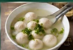
ลูกชิ้นปลา เนื้อแน่น สดใหม่ น้ำซุปรหอมอร่อย