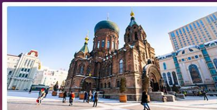
โบสถ์ซันต์โซเฟีย