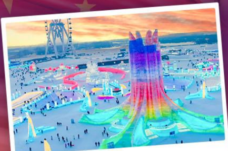
เทศกาลแกะสลักหิมะ