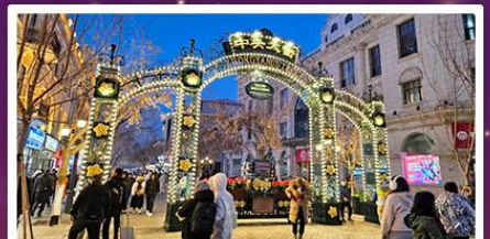
ถนนจงหยาง