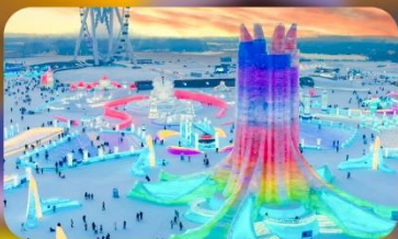
เทศกาลแกะสลักหิมะ