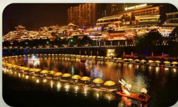
เมืองโบราณเซียนเิน