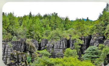
ชิวโอบูย่าสโตนฟอเรสต์