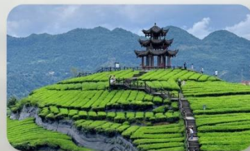
ไร่ใบชาอู่เจีย