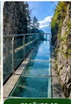
ทางเดินกระจก