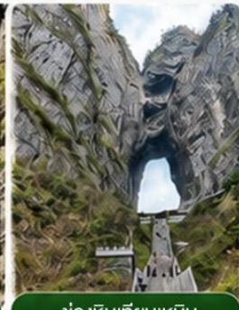
ช่องหินเทียนเหมิน