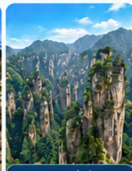
ภูเขาฮัลเลลูย่าห์ (อวตาร)