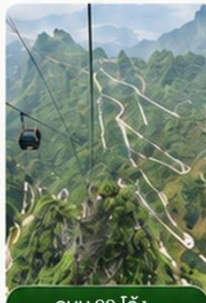
ถนน 99 โค้ง

"นั่งกระเช้าขึ้นสู่ยอดเขาเทียนเหมินซาน" ชมความงามของภูเขานับร้อยยอดที่สูงเสียดฟ้า (รวมค่ากระเช้าไป-กลับ ซึ่งในวันเดินทางอาจมีการปรับเปลี่ยนการขึ้น/ลง) ระหว่างทางตื่นตาตื่นใจไปกับ "ถนน 99 โค้ง" เส้นทางขึ้นเขาเลาะหน้าผาที่มีโค้งมากถึง 99 โค้ง จากบนกระเช้า ชมความอลังการของ "ช่องหินเทียนเหมิน" (กำแพงประตูสวรรค์) ที่มีทัศนียภาพแปลกมหัศจรรย์และพบเห็นได้น้อยมากในโลกปัจจุบัน และเดินชมทัศนียภาพของ หน้าผาลอยฟ้า ที่งดงามที่สุดแห่งหนึ่ง พร้อมกับท้าทายความหวาดเสียวของ "ทางเดินกระจก" ที่มีระยะทางประมาณ 60 เมตร เมื่อก้มลงมองไปยังเบื้องล่างสามารถมองเห็นทุกสิ่งทุกอย่างที่อยู่ภายใต้ทางเดินกระจกทั้งหมด (ทางเดินกระจก เปิด-ปิด ให้บริการจะขึ้นอยู่กับสภาพอากาศ)