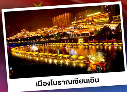
เมืองโบราณเซียนเิน