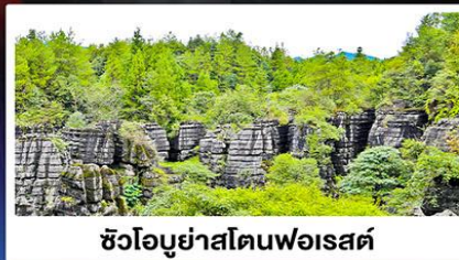
ซัวโอบูยาสโตนฟอเรสต์