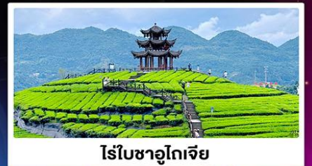
ไร่ใบชาอุโกเจีย