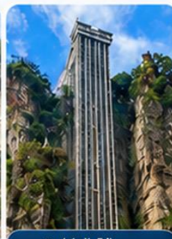
ลิฟต์แก้วไปหลง