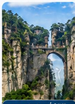
สะพานอันดิมหนึ่งใต้ฟ้า

ภูเขาอวตาร เติบโตอนุรักษ์ต่อเนื่องมาจากทางด้านทิศเหนือของอุทยานแห่งชาติจางเจี๋ยเจีย มีอากาศเย็นสบายตลอดทั้งปี และมีจุดชมวิวที่สามารถมองเห็นยอดเขาอันยิ่งใหญ่ นับมากกว่าร้อยยอด ตื่นตาตื่นใจไปกับทัศนียภาพที่สวยงามแสนประทับใจ "ลิฟต์แก้วไปหลง" สูงสุดที่สูงสุด 326 เมตร ชมดินแดนมหัศจรรย์ทางธรรมชาติของจีน "ภูเขาฮัลเลลูย่าห์" ที่ทุกคนคุ้นตาค้นได้จากภาพยนตร์ชื่อดังอวตาร ชมทิวทัศน์ที่สวยงามของ "สะพานอันดิมหนึ่งใต้ฟ้า" (เทียนเสี่ยวตี้อี้เฉียว) และชมชมบรรยากาศริม "ลำธารเสี้น้ำทอง" สองข้างทางเขียวชะอุ่มไปด้วยต้นไม้ขนานพันธุ์ "นั่งกระเช้าเทียนจื่อซาน" ลงสู่ด้านล่าง ระหว่างทางผ่านชมภูเขาอันน้อยใหญ่ (รวมค่าลิฟท์ 1 ภา กระเช้า 1 ภา)