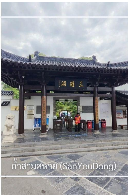
ถ้าสามสหาย (SanYouDong)