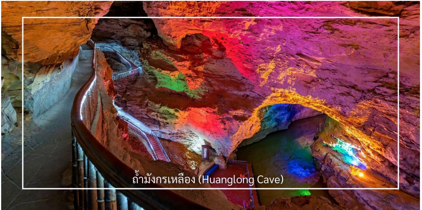
ถ้ำมังกรเหลือง (Huanglong Cave)

ถ้ำมังกรเหลือง หนึ่งในถ้ำหินงอกหินย้อยที่ยิ่งใหญ่และงดงามที่สุดของเมืองจางเจียเจี๋ย แหล่งท่องเที่ยวทางธรรมชาติที่ได้รับการยกย่องว่าเป็น “พระราชวังใต้พิภพ” แห่งดินแดนอุ่หลิงหยวน ถ้ำแห่งนี้มีโครงสร้างขนาดใหญ่ แบ่งออกเป็น 4 ชั้น ภายในประกอบด้วยห้องโถงกว้างใหญ่ ลำธารใต้ดิน บึงธรรมชาติ และแนวระเบียงหินที่ทอดยาวอย่างน่าตื่นตา ความมหัศจรรย์ของหินงอกหินย้อยซึ่งก่อตัวสะสมมาเป็นเวลาหลายล้านปี ได้รับการจัดแสงอย่างสวยงาม ช่วยขับเน้นรูปร่างแปลกตาให้โดดเด่น ราวงานศิลป์จากธรรมชาติ สัมผัสประสบการณ์ ล่องเรือชมแสงสีภายในถ้ำ โดยเรือจะนำท่านลัดเลาะไปตามสายน้ำใต้ถ้ำให้ท่านได้สัมผัสกับความยิ่งใหญ่ของธรรมชาติอันน่าอัศจรรย์ได้อย่างใกล้ชิด