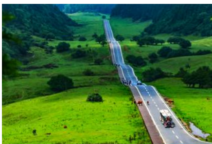
อุทยานเขานางฟ้า

พักที่ DAWEI YING HOTEL โรงแรมระดับ 4 ดาวหรือเทียบเท่า เมืองอู่หลง