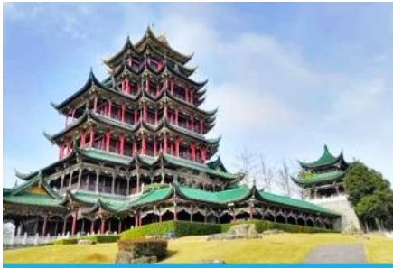
วัดหลงเอินซื่อ