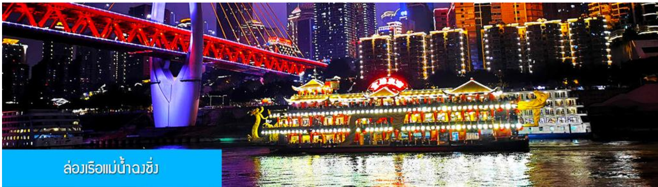
ล่องเรือแม่น้ำจิว

ไกด์นำเสนอ OPTIONAL TOUR แพคเกจล่องเรือ ชมความสวยงามของสองริมฝั่งแม่น้ำเมืองฉงชิ่ง + สตึกหม่าล่าต้นตำหรับ ท่านละ 380 หยวน หรือประมาณ 1,900 บาท