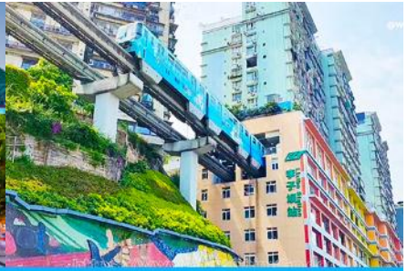
รถไฟวิวกะตุติก

วันที่ห้า นครฉงชิ่ง-วัดหลงเอินซื่อ-หอประชุมศาลาประชาชน-ชมรถไฟกะตุติก –เมืองโบราณฉือชิว-สนามบินฉงชิ่ง