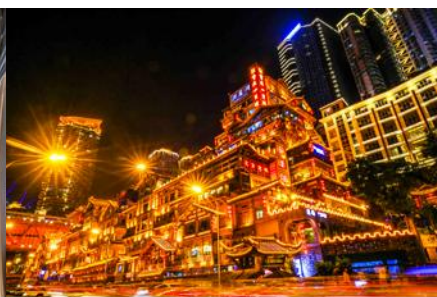
ย่านหงหยาดัว