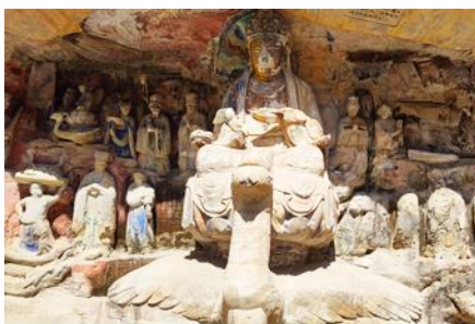
อุทยานต้าจู่

พักที่ HOLIDAY INN EXPRESS HOTEL โรงแรมระดับ 4 ดาวหรือเทียบเท่า เมืองฉงชิ่ง