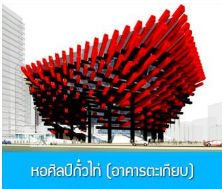
หอศิลป์ปักกิ่ง (อาคารตะเกียบ)