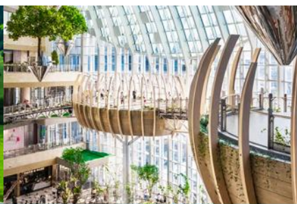
ห้างสรรพสินค้าฮ้างกวงหวนฮ้อปี้งเซ็นเตอร์