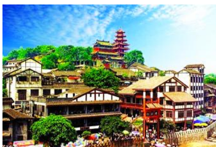
เมืองโบราณ ฉือชิว

เที่ยง รับประทานอาหารกลางวัน ณ ภัตตาคาร (8)