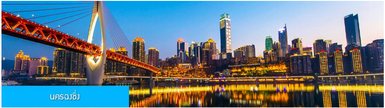
นครฉงชิ่ง