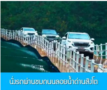
นั่งรถผ่านซบถนนลอยน้ำด่านสิงโต