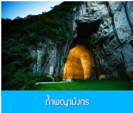
ถ้ำพญามังกร

พักที่ ENHSI JINMA HOTEL โรงแรมระดับ 4 ดาวหรือเทียบเท่าในเมืองเินซือ