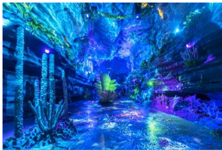
ป่าหิน สั่วปู้ย่า

ค่ำ รับประทานอาหารค่ำ ณ ภัตตาคาร (11) พักที่ โรงแรม ENHSI JINMA HOTEL ระดับ 4 ดาวท้องถิ่นหรือเทียบเท่าในเมืองเินซือ