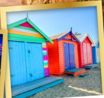
โบสถ์ต้น บาร์ตัง บ็อกซ์