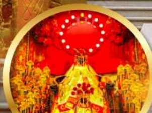
เจ้าแม่กวนอิมฮ่องฮ่า ขอพรทรัพย์สิน ความมั่งคั่ง