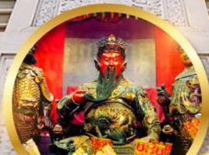
เทพเจ้ากวนอู ขอพรชื่อเสียง ฝันของ ลูกถึงบั้นปลาย