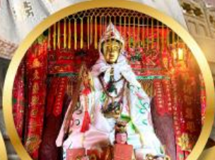
วัดหลินฟ้า ขอพรเสริมโชคลาภในธุรกิจ