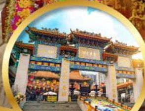
วัดหวังต้าเซียน ขอพรด้านสุขภาพ