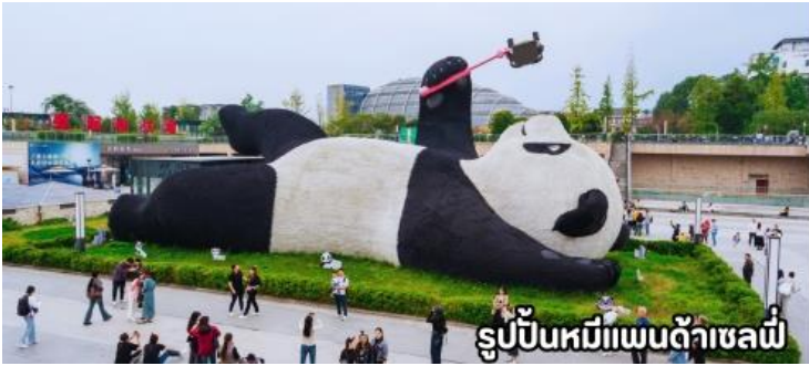
รูปปั้นหมีแพนด้าเซลฟี

เช้า บริการอาหารเช้า ณ ห้องอาหารของโรงแรม