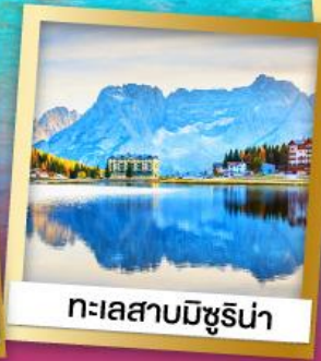
ทะเลสาบมิซูริน่า