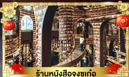
ร้านหนังสือจงซูเก้อ