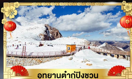
อุทยานต้ากู่ปิงชวน