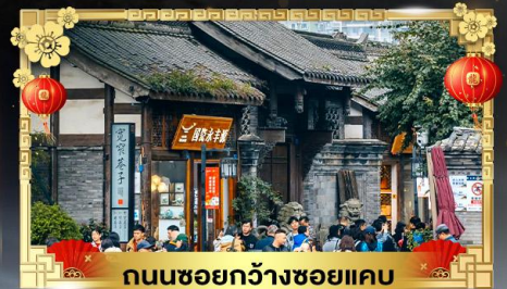
ถนนชอยกวางชอยแคบ