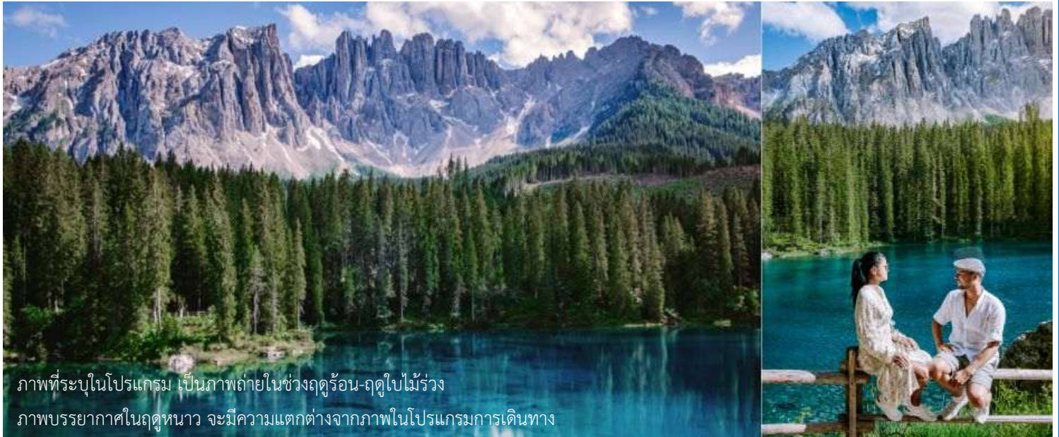
ภาพที่ระบุในโปรแกรม เป็นภาพถ่ายในช่วงฤดูร้อน-ฤดูใบไม้ร่วง ภาพบรรยากาศในฤดูหนาว จะมีความแตกต่างจากภาพโปรแกรมการเดินทาง

มองเห็นได้อย่างชัดเจนจากทุกมุมมอง ท่านจะได้ชมความงามของภูเขา Dolomites ซึ่งได้รับการขึ้นทะเบียนเป็นมรดกโลกจากยูเนสโก ถึงเวลาอันสามครรนำท่านเดินทางกลับลงมาที่ตัวเมืองออดิเซ่