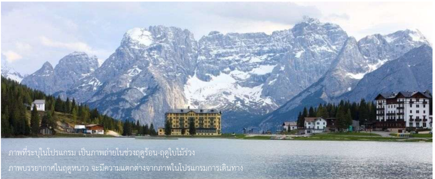
ภาพที่ระบุในโปรแกรม เป็นภาพถ่ายในช่วงฤดูร้อน-ฤดูใบไม้ร่วง ภาพบรรยากาศในฤดูหนาว จะมีความแตกต่างจากภาพในโปรแกรมการเดินทาง