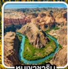
หุบเขาชาริน