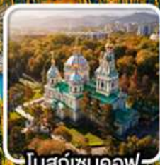
โบสถ์เซนคอฟ

นั่งกระเช้าคอนโดล่าขึ้นสู่ชิมบูลัก สกีรีสอร์ท ไข่มุกแห่งเทือกเขาเทียนชาน ทะเลสาบโคลโซ หุบเขาเจตี้ โอกูซ / ภูเขาหินเทพนิยาย / ทะเลสาบอัสซิกกุล ชมการแสดงการล่าเหยื่อของนกอินทรี