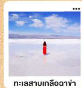
ทะเลสาบเกลือฉางซ่า