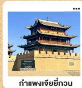
ต้าแพงเจียยกวน