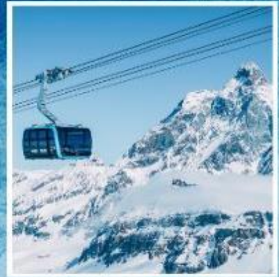
GLACIER PARADISE TOP OF ZERMATT