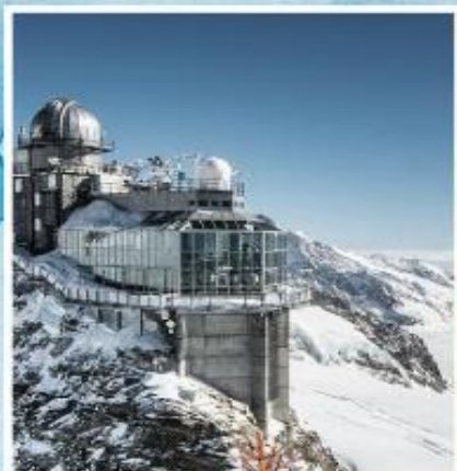
JUNGFRAUJOCH "Top of Europe"