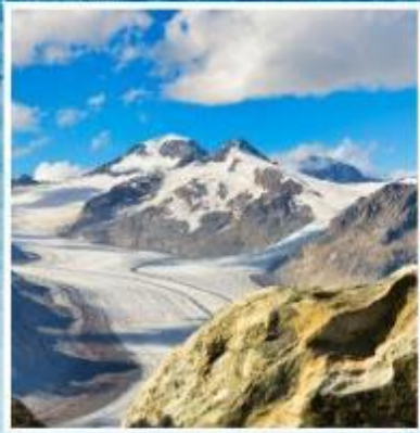
ALETCH GLACIER Riederalp, Bettmeralp