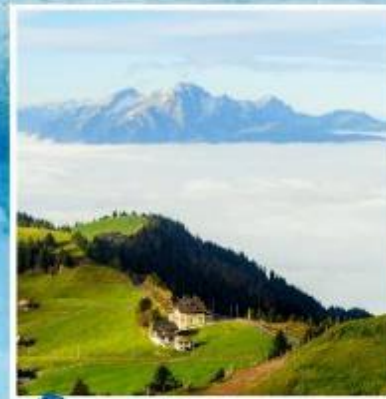
RIGI KULM Queen of the Mountains