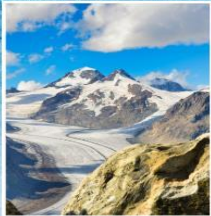
ALETCH GLACIER Riederalp, Bettmeralp