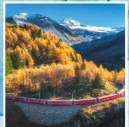
BERNINA EXPRESS Unesco