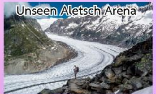
Unseen Aletsch Arena

ชมความงดงามของทะเลสาบเจนีวา ชมปราสาทชิลองที่เมืองมอว์คเทออร์ ล่องเรือชมความงามของทะเลสาบลูเซิร์น, พักในหมู่บ้านเซอร์แมท (เมืองตากอากาศปลอดมลพิษ ที่ได้ชื่อว่าสวยงามเหมือนสวรรค์บนดิน)