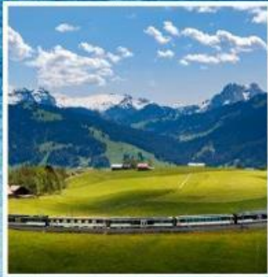
GOLDEN PASS LINE Montreux-Zweisimmen