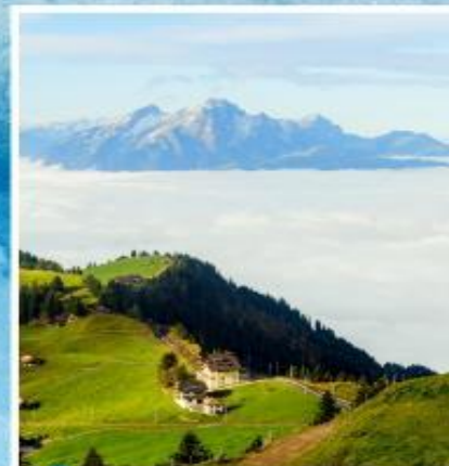
RIGI KULM Queen of the Mountains