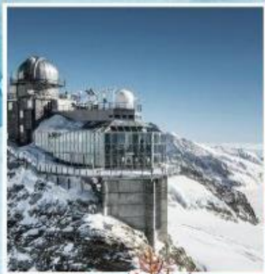
JUNGFRAUJOCH "Top of Europe"