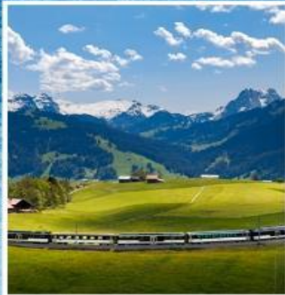
GOLDEN PASS LINE Montreux-Zweisimmen