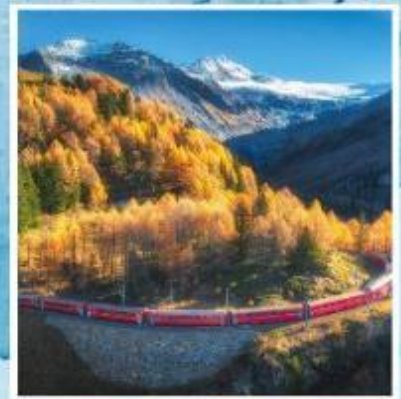
BERNINA EXPRESS Unesco

ออกเดินทาง 22-30 ต.ค. / 31 ต.ค.-08 พ.ย.69