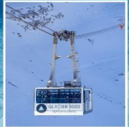
GLACIER3000 Peak walk by Tissot