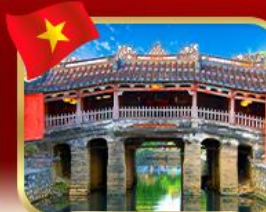
สะพานญี่ปุ่นโบราณ