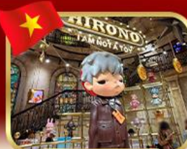
popmart บานาฮิลล์