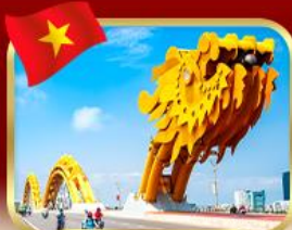
สะพานมังกร ดานัง