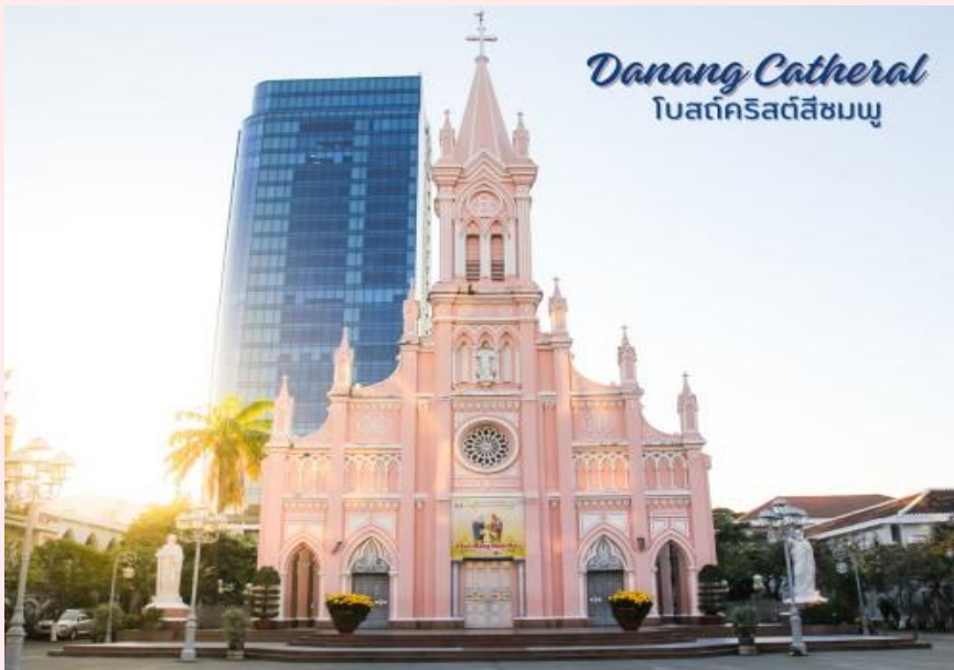
Danang Cathedral โบสถ์คริสต์สิชมพู่

นำท่านถ่ายรูป โบสถ์คริสต์ดานัง หรือโบสถ์คริสต์สิชมพู่ (Danang Cathedral) สร้างขึ้นสมัยเวียดนาม ตกเป็นอาณานิคมของฝรั่งเศส สถาปัตยกรรมสไตล์ โกธิค ยตกแต่งด้วยความประณีตสวยงาม ตัวโบสถ์ เป็นสีชมพูทั้งหลัง ตัดขอบด้วยสีขาว เป็นอีกหนึ่ง สถานที่ที่ไม่ควรต้องพลาดเมื่อมาเยือนเมืองดานัง จากนั้น อีตระช้อปปีง ตลาดฮาน อีตระเลือกซื้อ สินค้าหลากหลายชนิด เช่นผ้า เหล้า บุหรี่ และของ กินต่างๆ เป็นตลาดสดและขายสินค้าพื้นเมืองของ เมืองดานัง