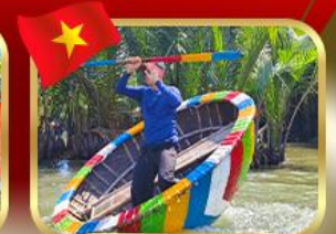
ล่องเรือกระดังที่ทาน