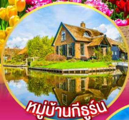
หมู่บ้านที่รู้รึบ