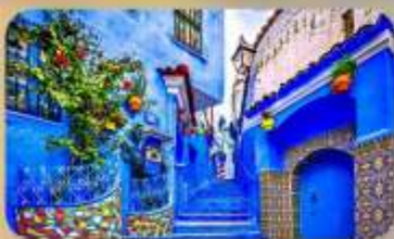
นครสีฟ้าเซฟซาอูน