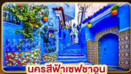
นครสีฟ้าเซฟซาอูน