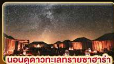
นอนดูดาวทะเลทรายซาฮารา