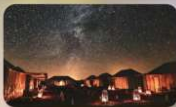
นอนดูดาวทะเลทรายซาฮารา