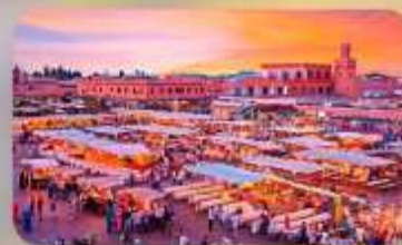
นครสีชมพูมาราเกช