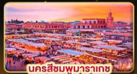
นครสีชมพูมารากษ