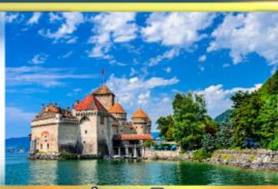
ปราสาทชิลยง