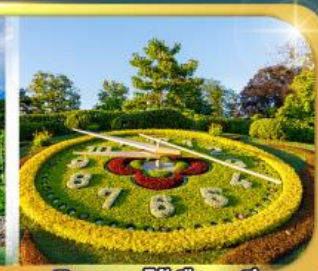
นาฬิกาดอกไม้เมืองเจนีวา