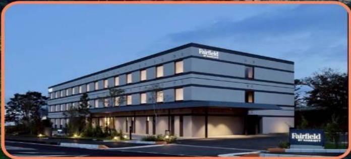
SEA SIDE VIEW

WESTERN STYLE STANDARD TWIN ROOM 25 SQM.