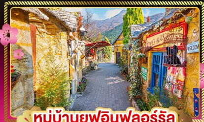
หมู่บ้านยูฟูอินฟลอรัล