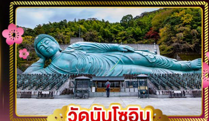
วัดนินโซอิน