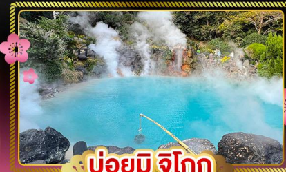
บ่อยูมิ จิโงกุ