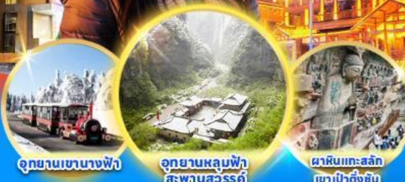
อุทยานเขานางฟ้า