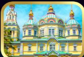
มหาวิหารเซนต์สเปียร์ อัลมาตี