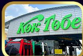
เซ็นทรัลโกทอบเชอวอัลมาตี

นั่งกระเช้าชิมบุลัค • ทะเลสาบโคลไซ • ชารินแกรนด์แคนยอน