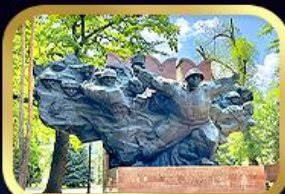
Panfilov Guardsmen Park