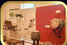
Museum of Folk Instrument