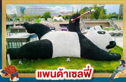
แพนด้าชิลฟี

ชมวัฒนธรรมชาติแบบ 360 องศา "อุทยานกู่เงาสีดรุณี"