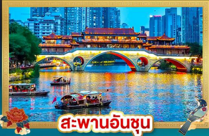
สะพานอันซุน