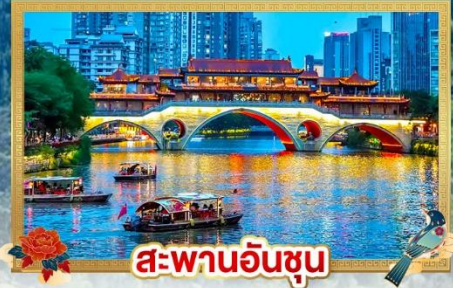
สะพานอันซุน