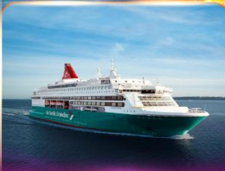
เรือสำราญ GO NORDIC CRUISE LINE