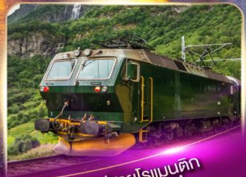
รถไฟสายโรเมนติก ฟลินส์บาน่า