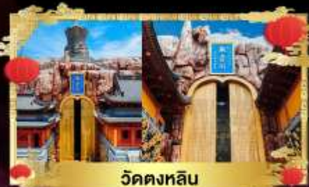
วัดตงหลิน