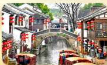
ถนนโบราณซานกง