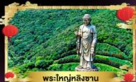
พระใหญ่หลิงซาน