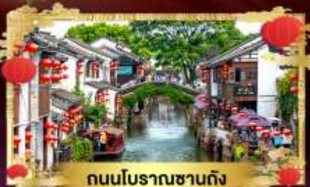
ถนนโบราณซางตง