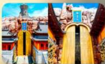
วัดคงหลิน