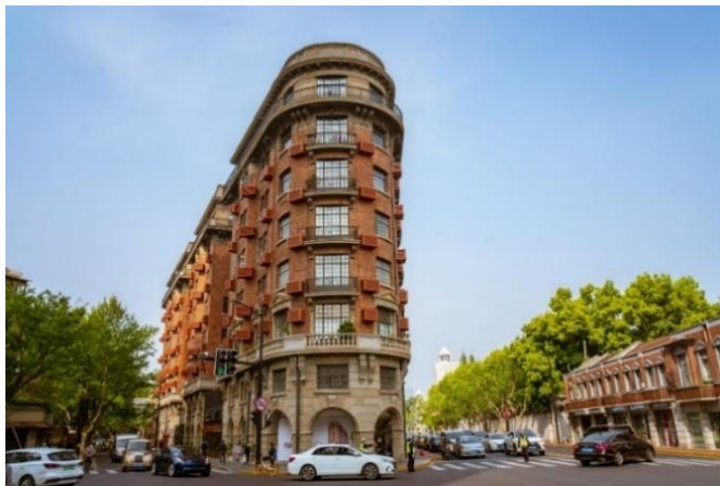
จากนั้นนำท่าน ไป Wukang Mansion

อาคารเก่าที่ได้รับการอนุรักษ์ไว้ สร้างเสร็จในปี ค.ศ. 1924 เป็นตึกโบราณสุดฮอตในย่านนี้ ตั้งอยู่อย่างโดดเด่นตรงห้า แยกพอดี เป็นอีกหนึ่งจุดยอดฮิต ที่เหล่านักท่องเที่ยวมารอคิว ถ่ายรูป อีสาระให้ท่านได้ถ่ายรูปและเดินเล่นที่ถนนอยู่ข้าง ตาม อัธยาศัย