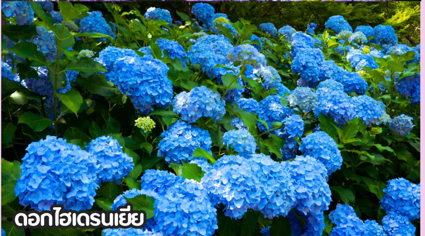
ดอกไฮเดรนเยีย

**หมายเหตุ: โปรแกรมชมดอกไม้ช่วงเดือน พ.ค. - ต.ค.2569 ในช่วง ณ วันเดินทางดังกล่าว หากดอกไม้ยังไม่บานหรืออาจจะร่วงหล่น..ทั้งนี้ขึ้นอยู่กับสภาพอากาศของแต่ละปี ทางบริษัทไม่ประกันติและไม่สามารถกำหนดการบานของดอกไม้ได้ ทางบริษัทฯ ขอสงวนสิทธิ์ปรับเปลี่ยนรายการท่องเที่ยวอื่นทดแทนนะคะ รบกวนท่านโปรดทราบและทำความเข้าใจค่ะ**