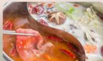
ชาบูบุฟเฟ่ต์สไตล์ไต้หวัน