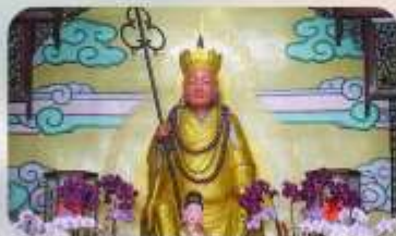
วัดพระถังซิมจั๋ง