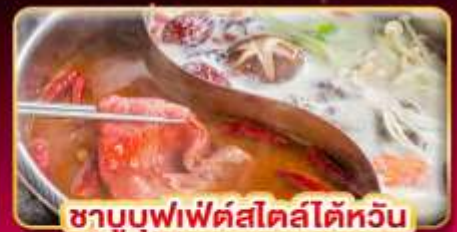
ชาบูบุฟเฟ่ต์สไตล์ไต้หวัน