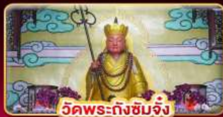
วัดพระถังซัมจั๋ง