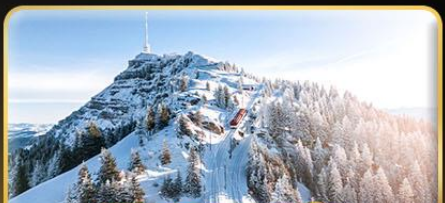
พีชิต 3 ยอดเขาดี Rigi / Schilthorn / Gornergrat