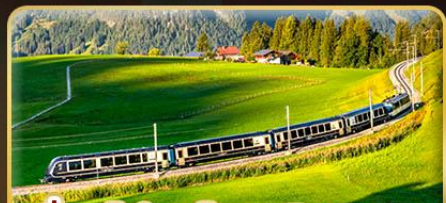
นั่งรถไฟสายโรเมนติก 3 สาย Golden Pass / Luzern Interlaken Express / Gornergrat