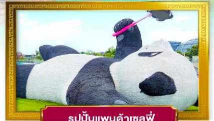
รูปปั้นแพนด้าเซลฟี