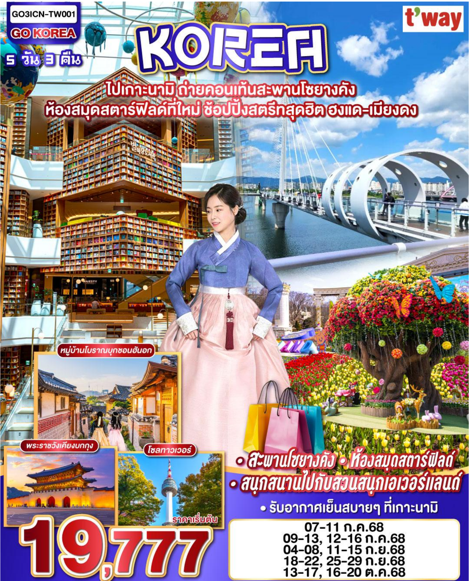
หมู่บ้านโบราณมุกซอนฮันอก

ไปเกาะนามิ ถ่ายคอนแทกสะพานโซยางคัง ห้องสมุดสตาร์ฟิลด์ที่ใหม่ ช้อปปิ้งสตรีทสุดฮิต ฮงแด-เมียงดง