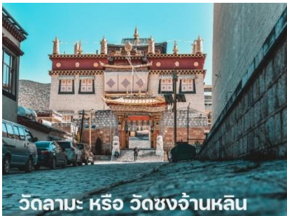
วัดลามะ หรือ วัดชงจ้านหลิน

นำท่านเดินทางสู่ ลี่เจียง เป็นเมืองที่ตั้งอยู่ทางตะวันตกเฉียงเหนือของมณฑลยูนนาน ประเทศจีน ลี่เจียงเป็นเมืองโบราณสวยงามและมีประวัติศาสตร์ยาวนานกว่า 800 ปี จึงได้รับขึ้นทะเบียนเป็นมรดกโลกจากองค์การยูเนสโก (UNESCO) เมื่อปี ค.ศ. 1977 ให้เป็นมรดกโลกทางวัฒนธรรม